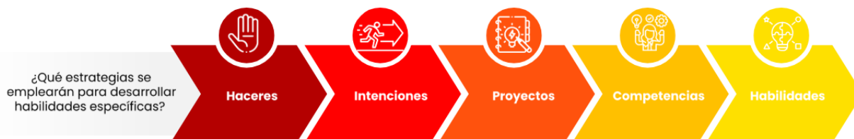
Ilustración 2. Articulación de Haceres e intenciones con otros elementos.

Hacer 1. Compartir con la comunidad expresiones de acuerdos, actitudes y acciones que puedan ser vivenciados en el aprendizaje de las lenguas.