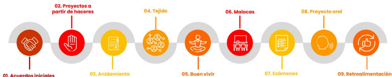
Ilustración 3. Ruta de aprendizaje de los cursos ILUD.