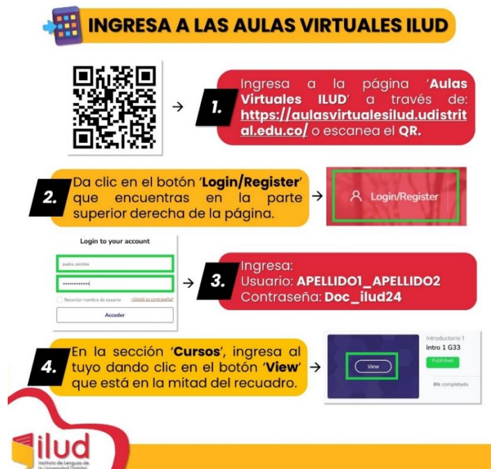
Imagen 01. Ingreso a las Aulas Virtuales

Para acceder a nuestras Aulas Virtuales ILUD en la plataforma Moodle, ingrese a la URL: https://aulasvirtualesilud.udistrital.edu.co/ . En la parte superior derecha encontrará el botón 'Login/Register', dé clic ahí y le dirigirá a la pantalla de inicio de sesión, donde debe introducir sus credenciales.