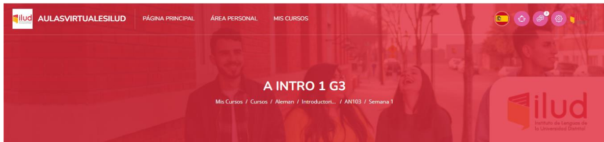
Imagen 02. Sección cabezote del curso.